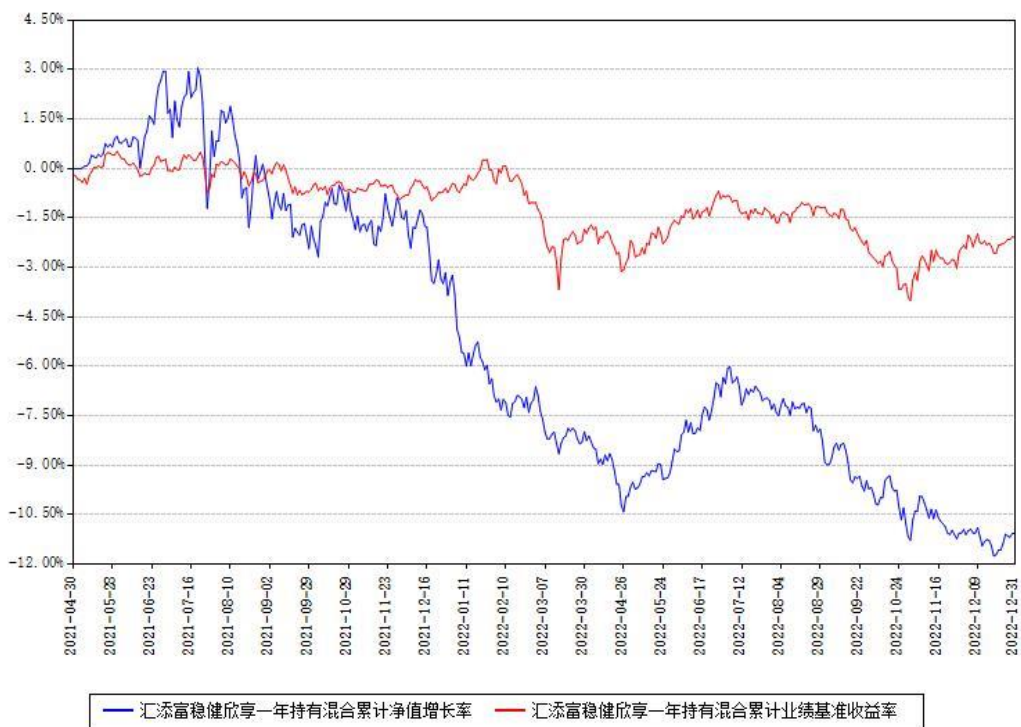
汇添富稳健欣享一年持有混合累计净值增长率与同期业绩基准收益率对比图