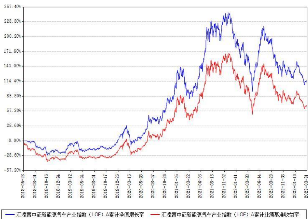
汇添富中证新能源汽车产业指数（LOF）A累计净值增长率与同期业绩基准收益率对比图