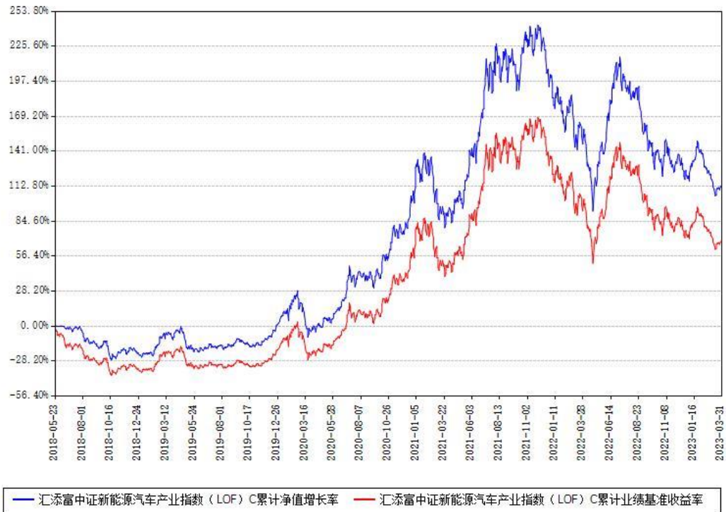
汇添富中证新能源汽车产业指数（LOF）C累计净值增长率与同期业绩基准收益率对比图