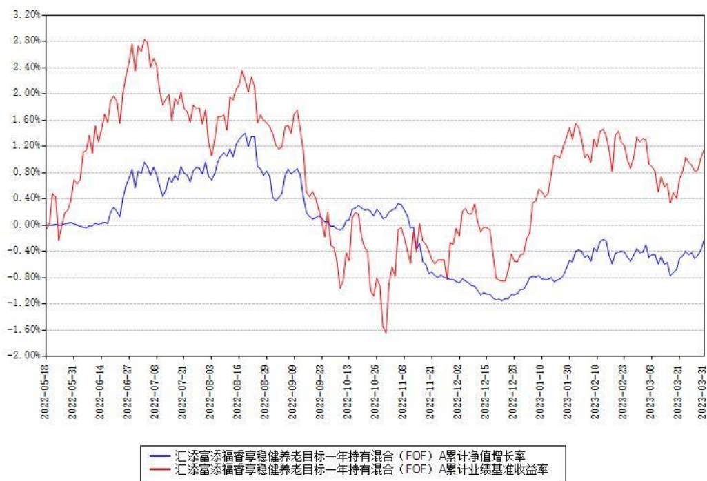
汇添富添福睿享稳健养老目标一年持有混合 (FOF) A 累计净值增长率与同期业绩基准收益率对比图

(二)自基金合同生效以来基金累计净值增长率变动及其与同期业绩比较基准收益率变动的比较图