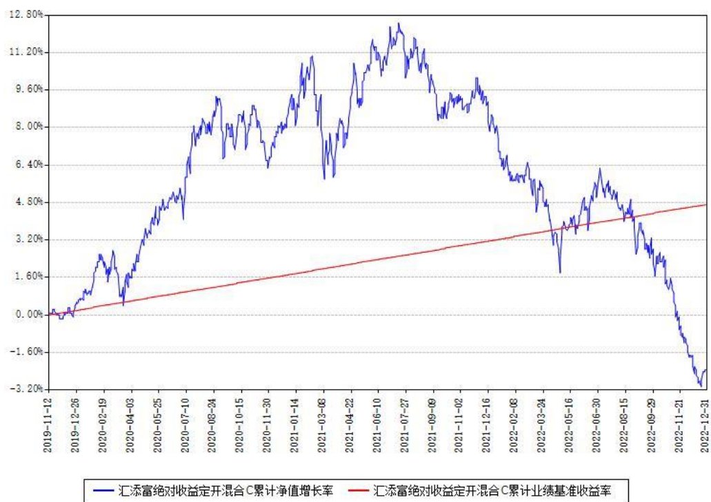
汇添富绝对收益定开混合C累计净值增长率与同期业绩基准收益率对比图