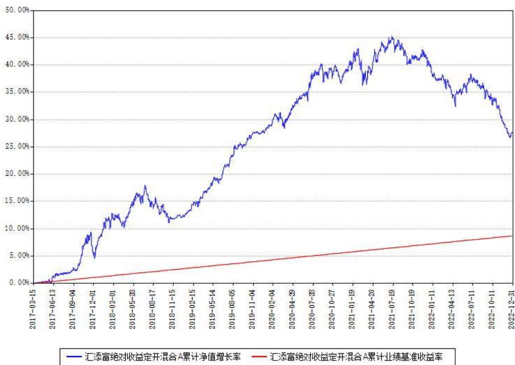
汇添富绝对收益定开混合A累计净值增长率与同期业绩基准收益率对比图