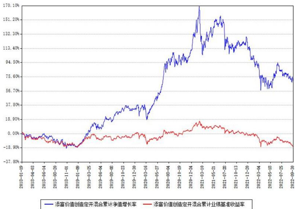
添富价值创造定开混合累计净值增长率与同期业绩基准收益率对比图