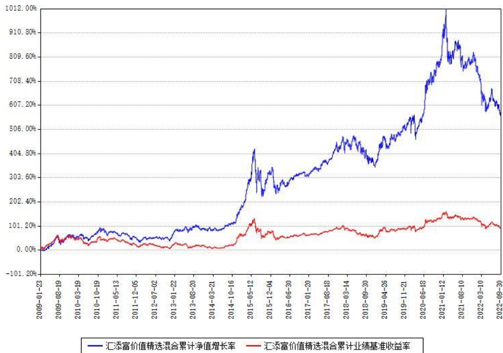
汇添富价值精选混合累计净值增长率与同期业绩基准收益率对比图