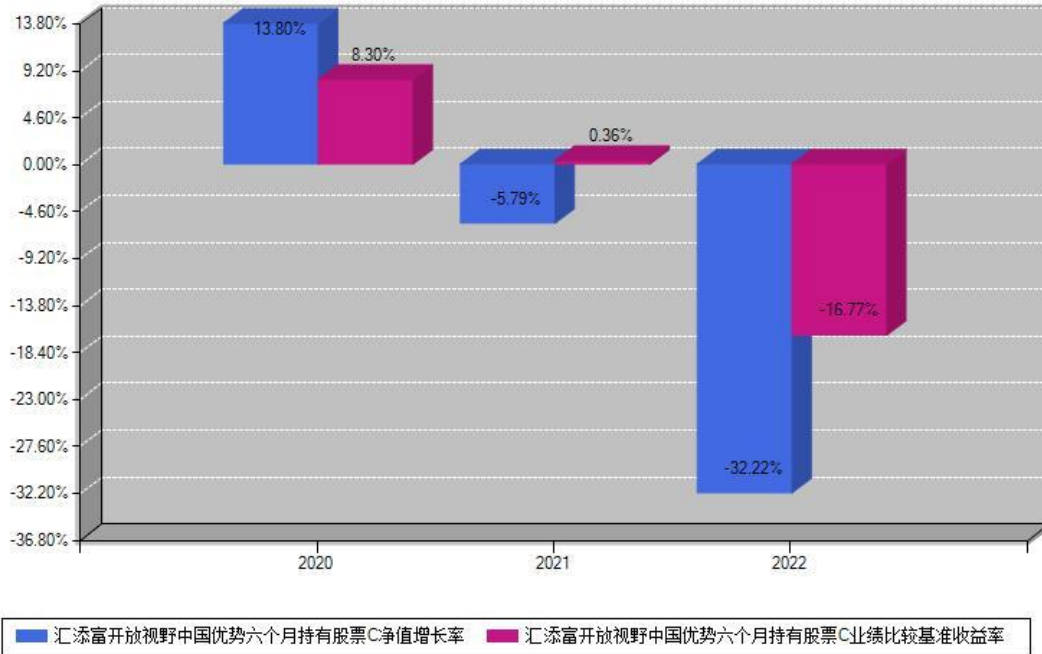
汇添富开放视野中国优势六个月持有股票C每年净值增长率与同期业绩基准收益率对比图

注：基金的过往业绩不代表未来表现。本《基金合同》生效之日为2020年07月22日，合同生效当年按实际存续期计算，不按整个自然年度进行折算。