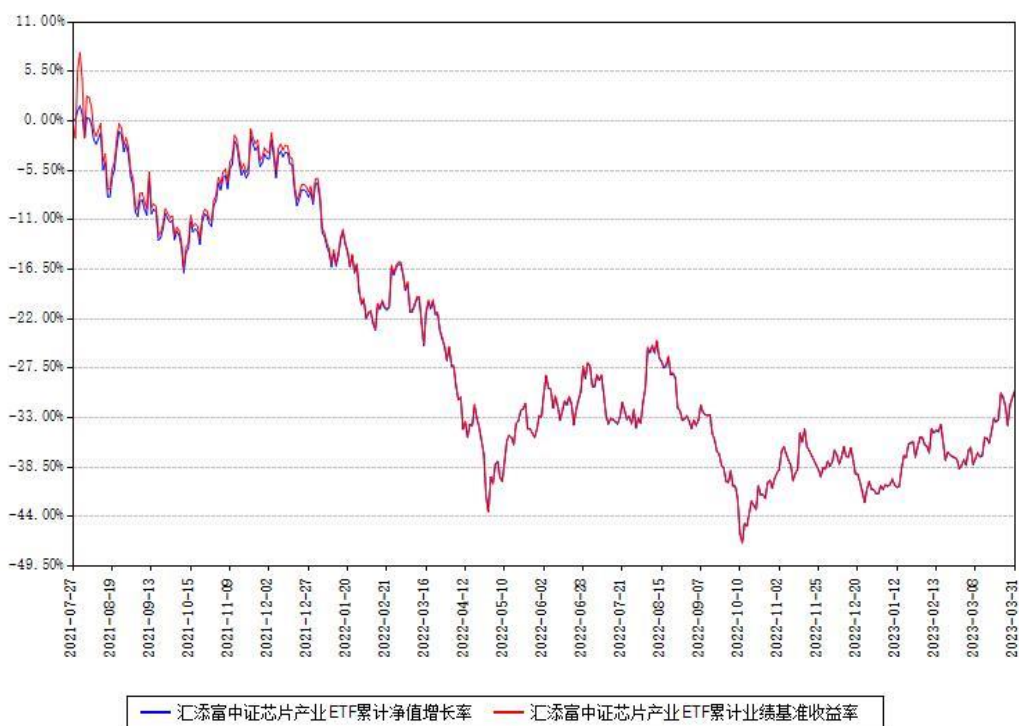
汇添富中证芯片产业ETF累计净值增长率与同期业绩基准收益率对比图