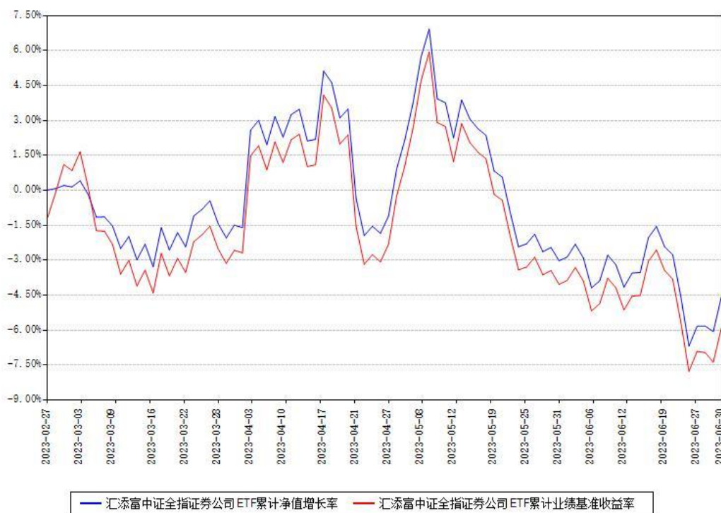
汇添富中证全指证券公司ETF累计净值增长率与同期业绩基准收益率对比图