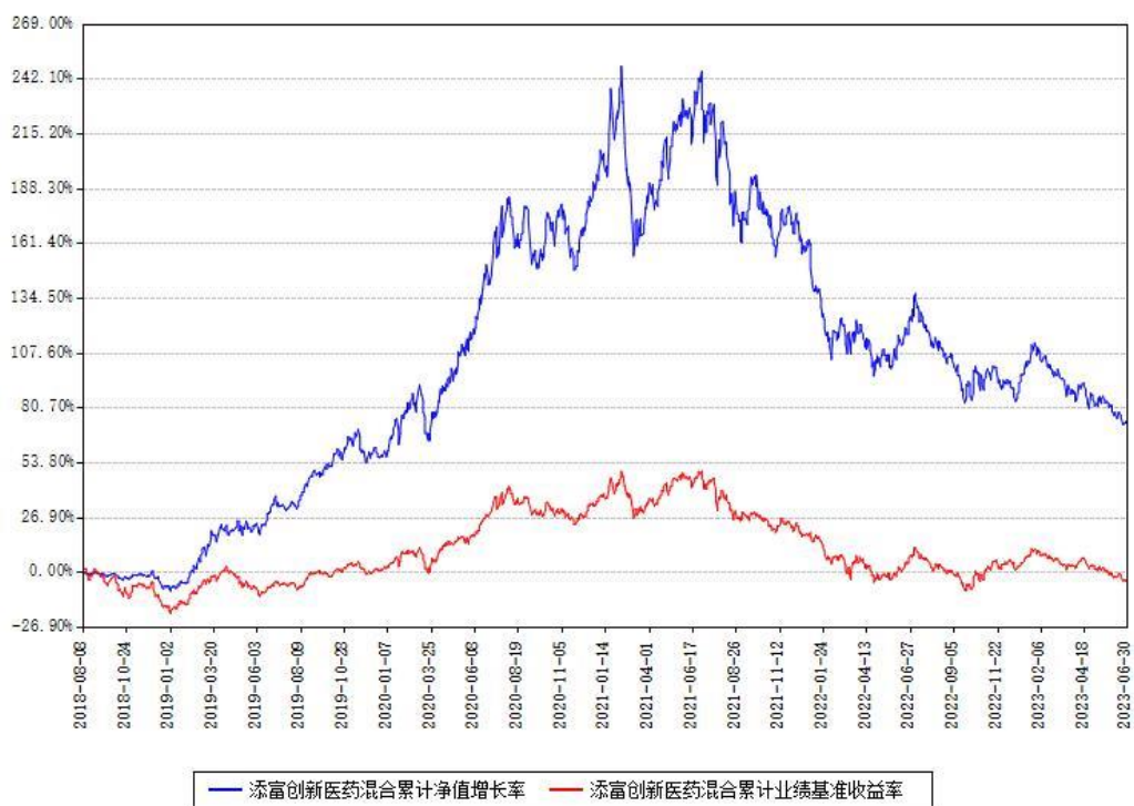
添富创新医药混合累计净值增长率与同期业绩基准收益率对比图