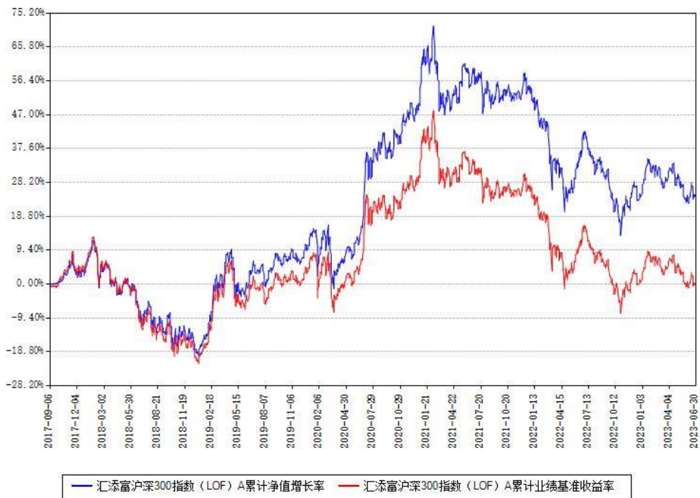
汇添富沪深300指数 (LOF) A 累计净值增长率与同期业绩基准收益率对比图