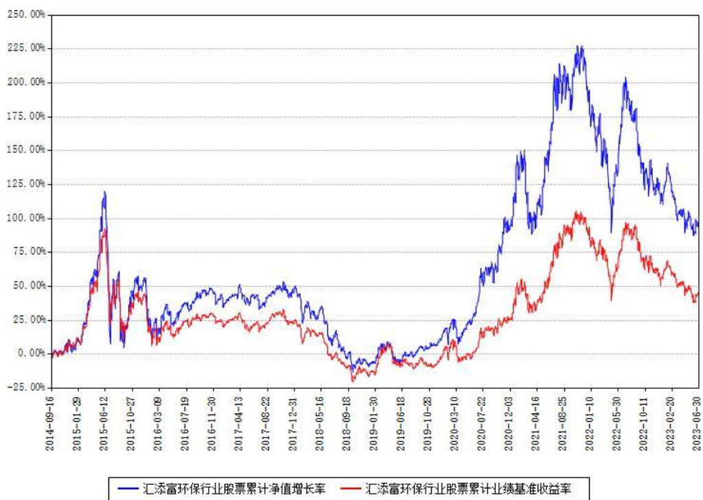
汇添富环保行业股票累计净值增长率与同期业绩基准收益率对比图