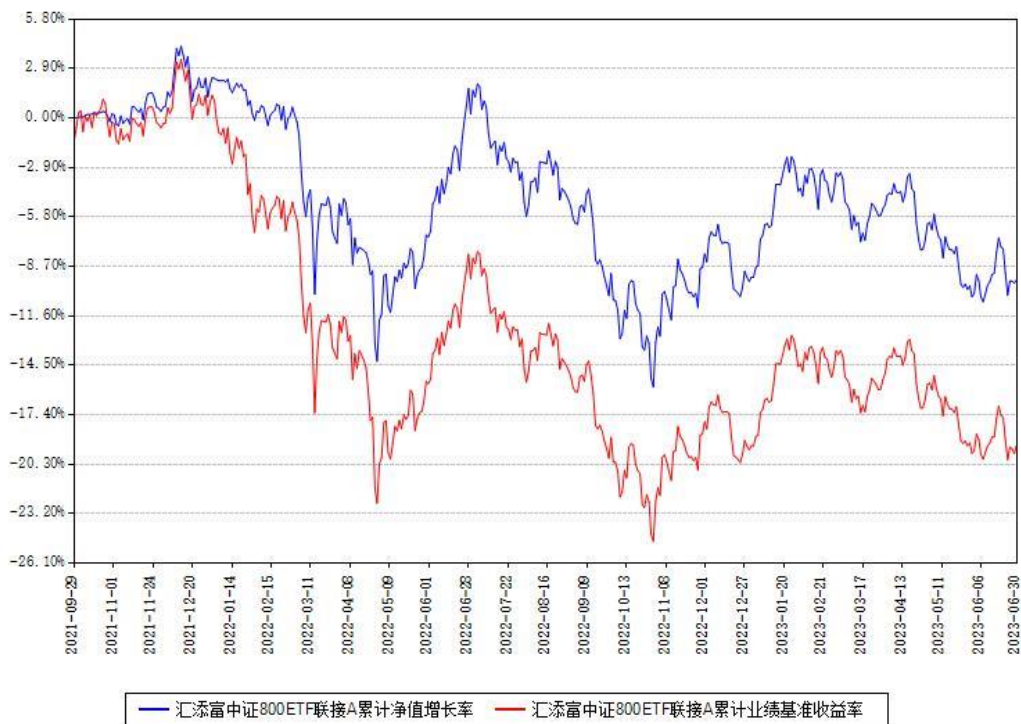
汇添富中证800ETF联接A累计净值增长率与同期业绩基准收益率对比图