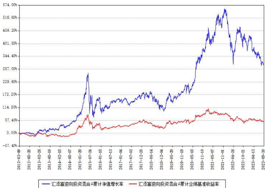
汇添富逆向投资混合A累计净值增长率与同期业绩基准收益率对比图