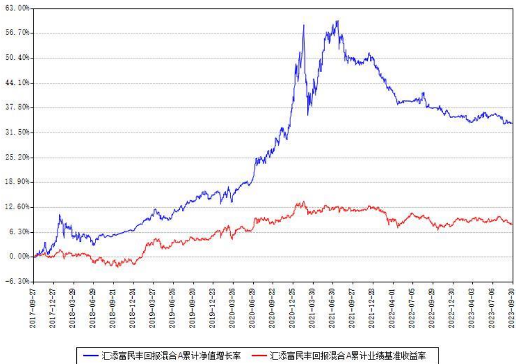
汇添富民丰回报混合A累计净值增长率与同期业绩比较基准收益率对比图