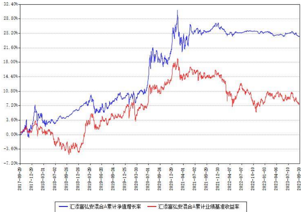
汇添富弘安混合A累计净值增长率与同期业绩基准收益率对比图