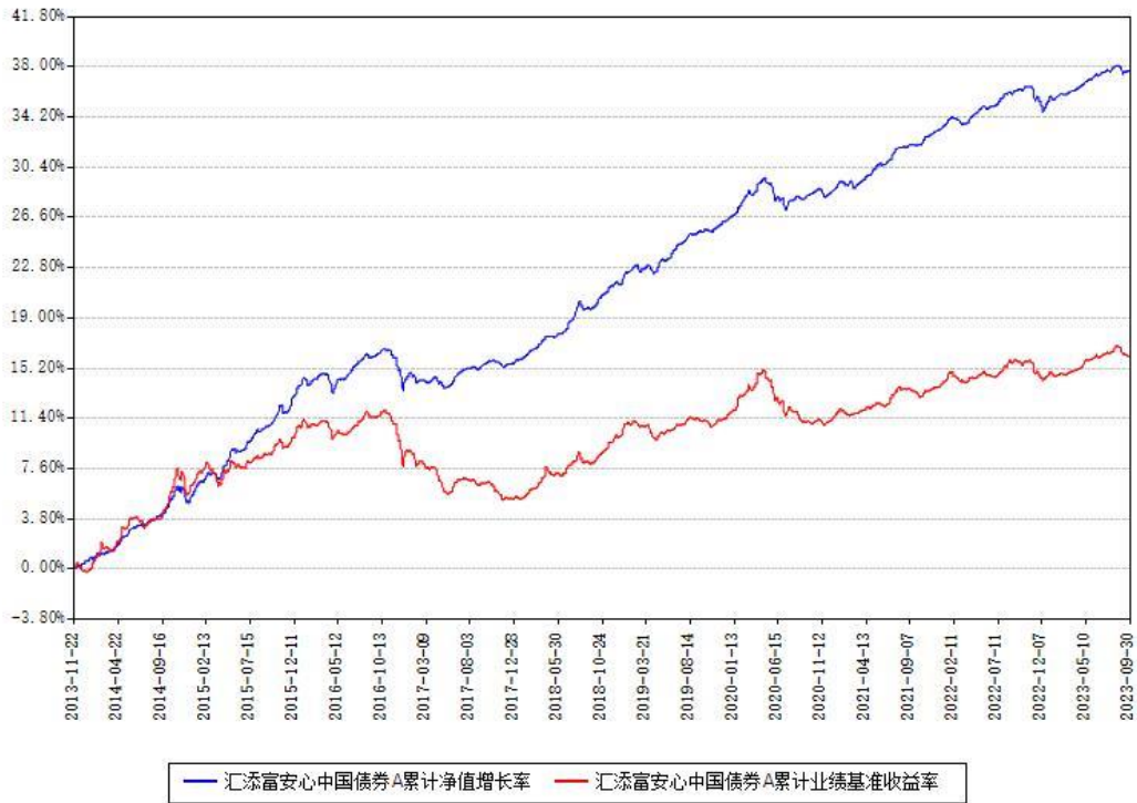
汇添富安心中国债券A累计净值增长率与同期业绩基准收益率对比图