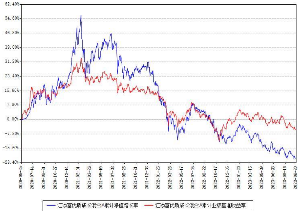
汇添富优质成长混合A累计净值增长率与同期业绩基准收益率对比图