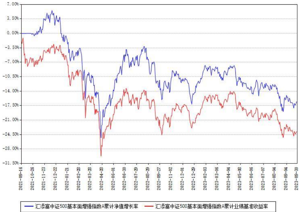
汇添富中证500基本面增强指数A累计净值增长率与同期业绩基准收益率对比图