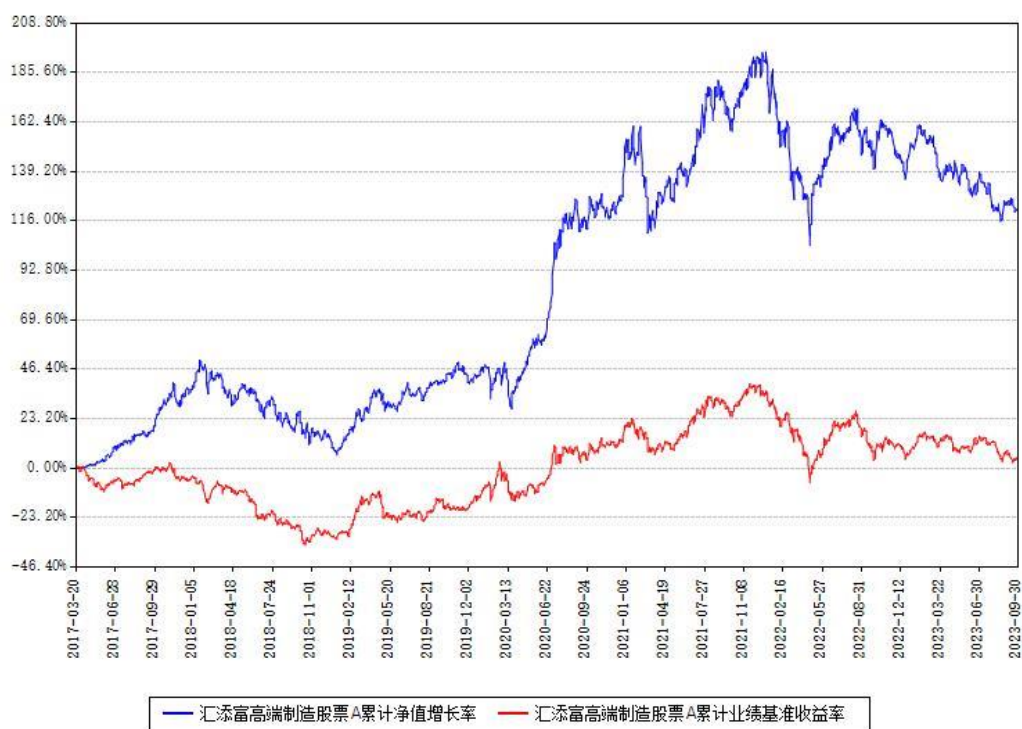
汇添富高端制造股票A累计净值增长率与同期业绩基准收益率对比图