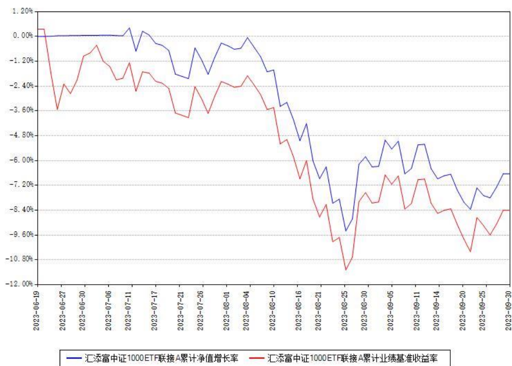
汇添富中证1000ETF联接A累计净值增长率与同期业绩基准收益率对比图