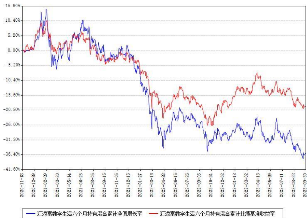
汇添富数字生活六个月持有混合累计净值增长率与同期业绩基准收益率对比图