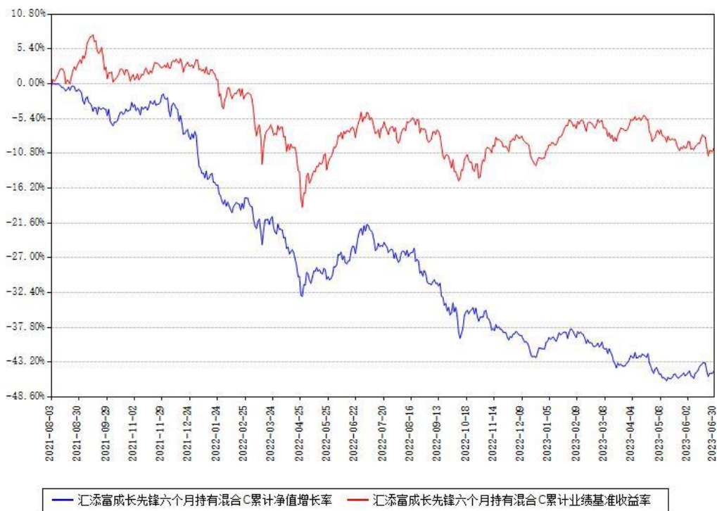
汇添富成长先锋六个月持有混合C累计净值增长率与同期业绩基准收益率对比图