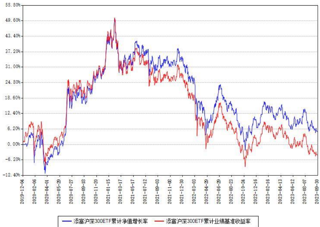
添富沪深300ETF累计净值增长率与同期业绩基准收益率对比图