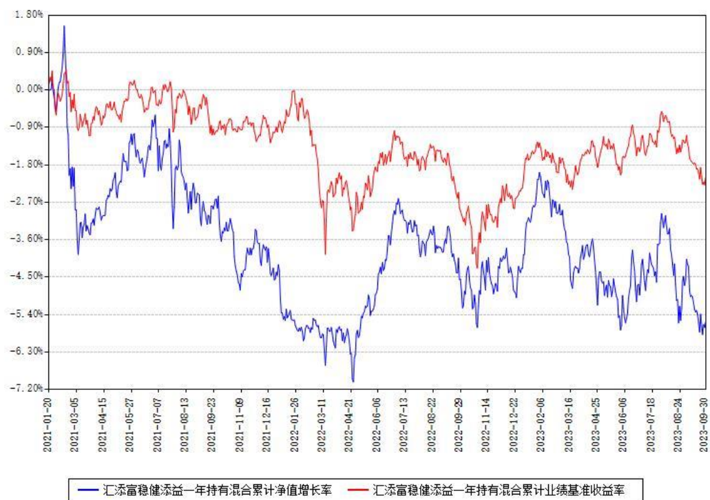
汇添富稳健添益一年持有混合累计净值增长率与同期业绩基准收益率对比图