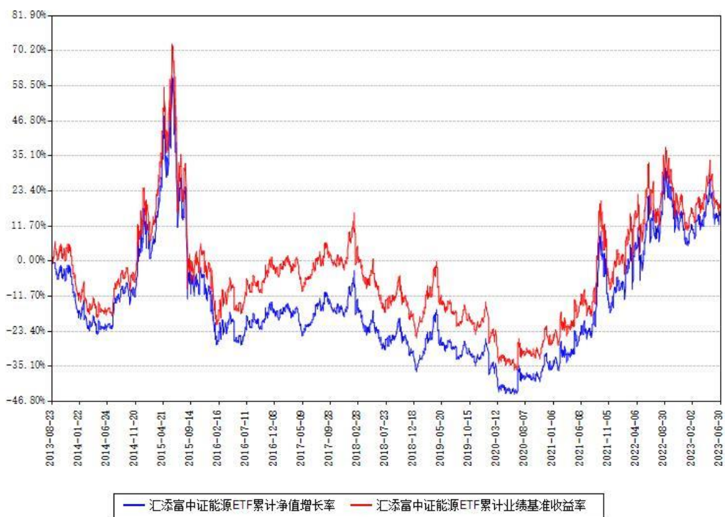
汇添富中证能源ETF累计净值增长率与同期业绩基准收益率对比图