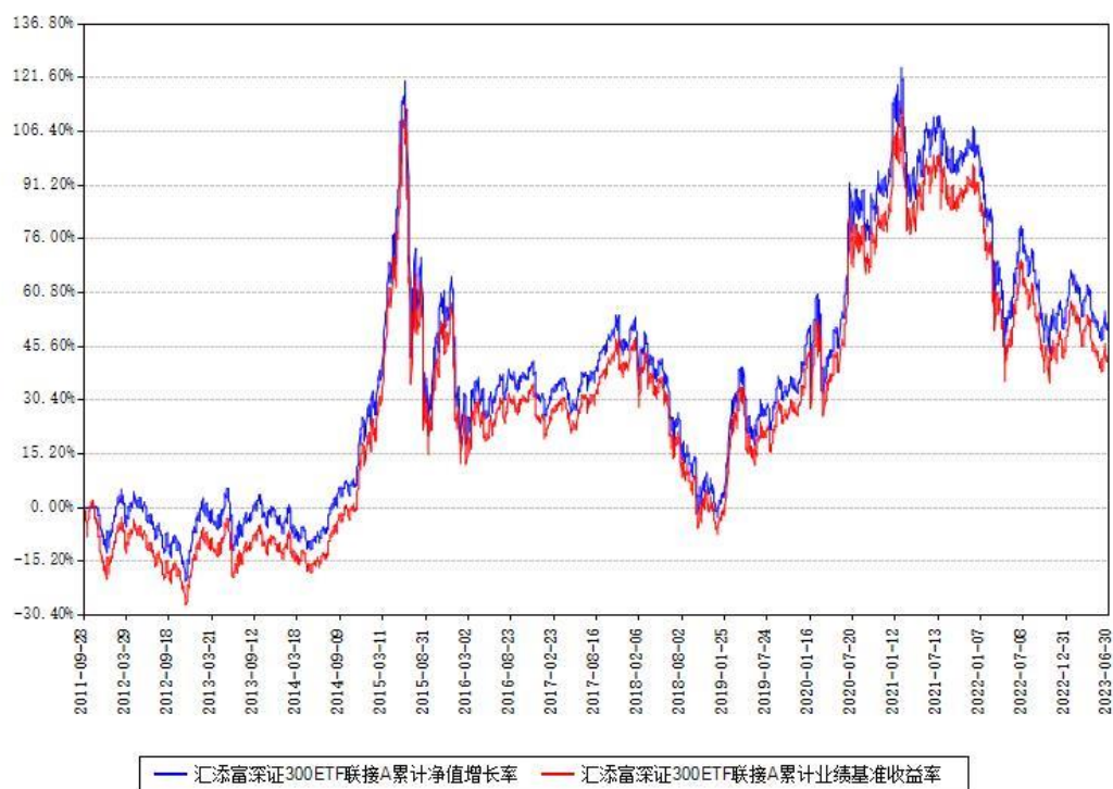
汇添富深证300ETF联接A累计净值增长率与同期业绩基准收益率对比图

(二)自基金合同生效以来基金累计净值增长率变动及其与同期业绩比较基准收益率变动的比较图