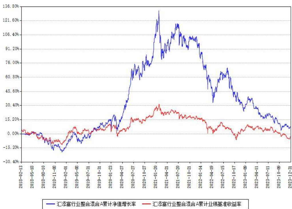
汇添富行业整合混合A累计净值增长率与同期业绩基准收益率对比图