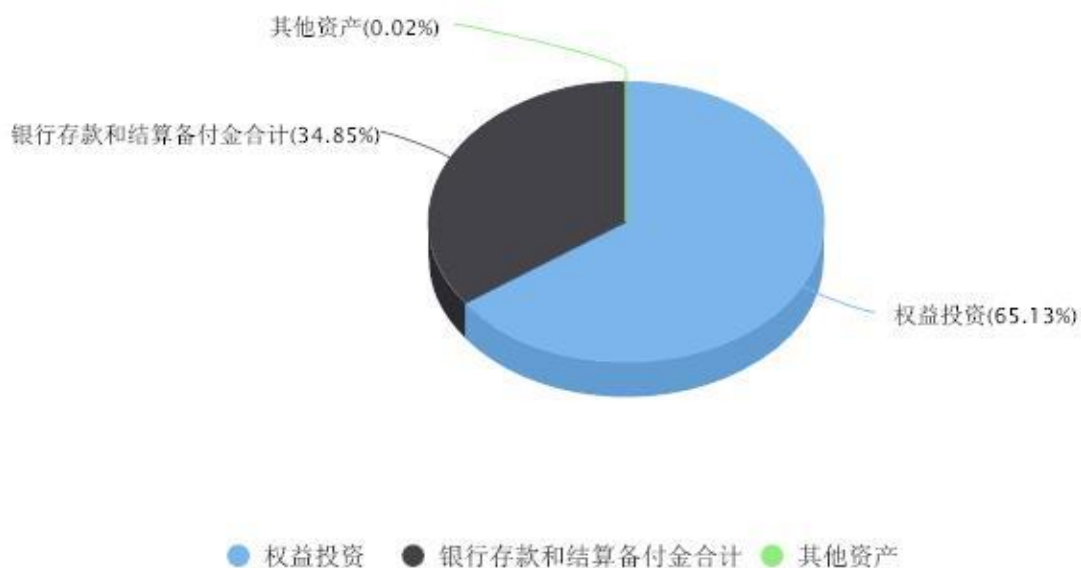
投资组合资产配置图表 数据截止日期:2022年12月31日