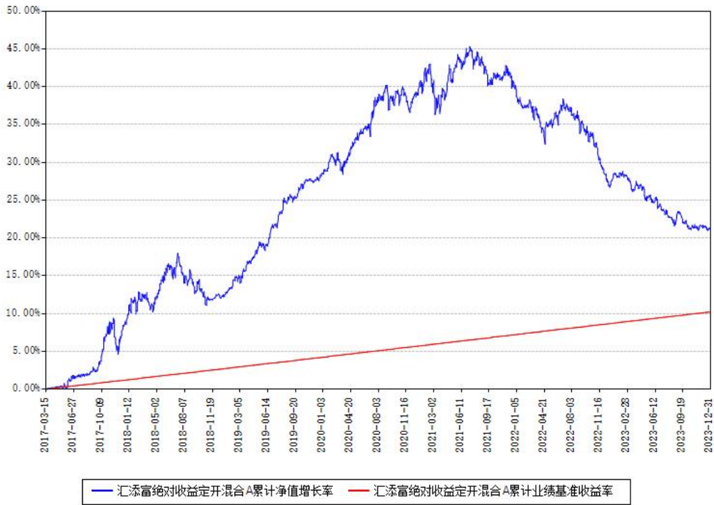
汇添富绝对收益定开混合A累计净值增长率与同期业绩基准收益率对比图