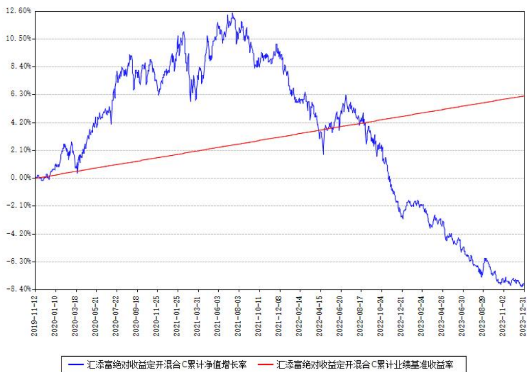
汇添富绝对收益定开混合C累计净值增长率与同期业绩基准收益率对比图