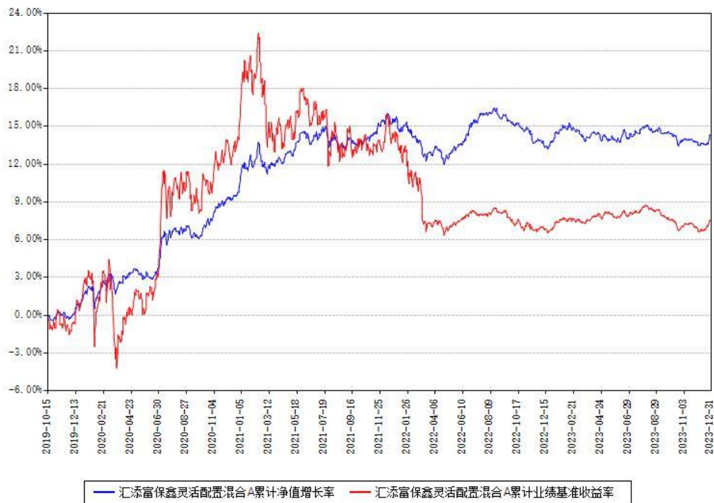
汇添富保鑫灵活配置混合A累计净值增长率与同期业绩基准收益率对比图