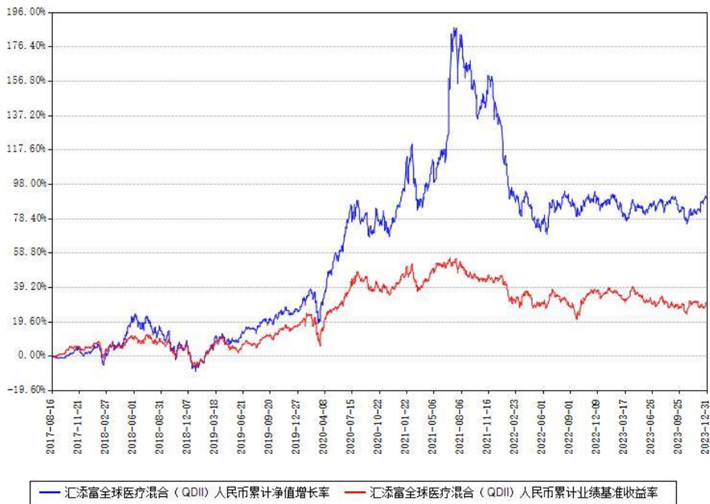
汇添富全球医疗混合（QDII）人民币累计净值增长率与同期业绩基准收益率对比图