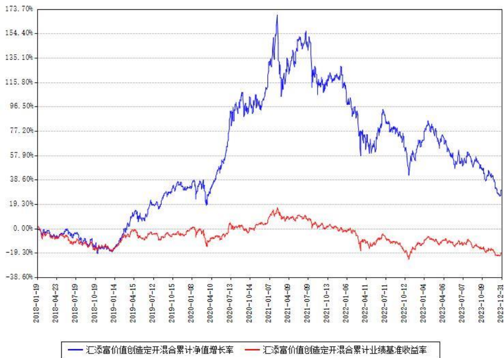
汇添富价值创造定开混合累计净值增长率与同期业绩基准收益率对比图

注：本基金建仓期为本《基金合同》生效之日（2018年01月19日）起6个月，建仓期结束时各项资产配置比例符合合同约定。