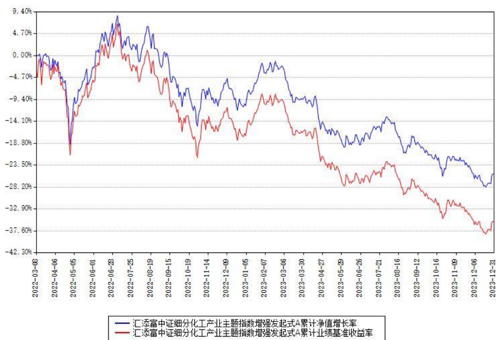
汇添富中证细分化工产业主题指数增强发起式A累计净值增长率与同期业绩比较基准收益率对比图