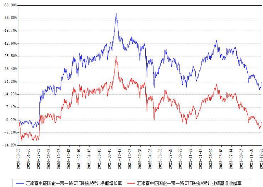
汇添富中证国企一带一路ETF联接A累计净值增长率与同期业绩基准收益率对比图