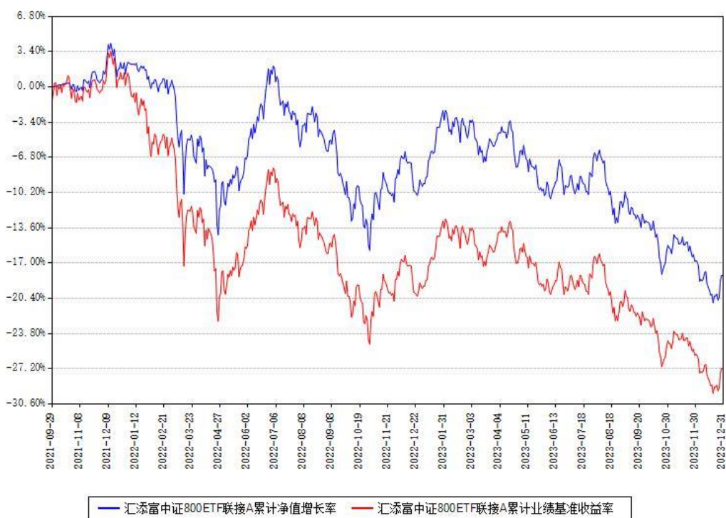
汇添富中证800ETF联接A累计净值增长率与同期业绩基准收益率对比图