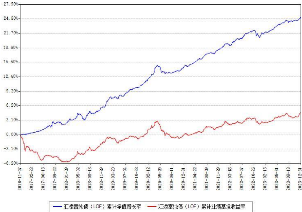
汇添富纯债（LOF）累计净值增长率与同期业绩基准收益率对比图

注：本基金建仓期为本《基金合同》生效之日（2016 年 11 月 07 日）起 6 个月，建仓期结束时各项资产配置比例符合合同约定。