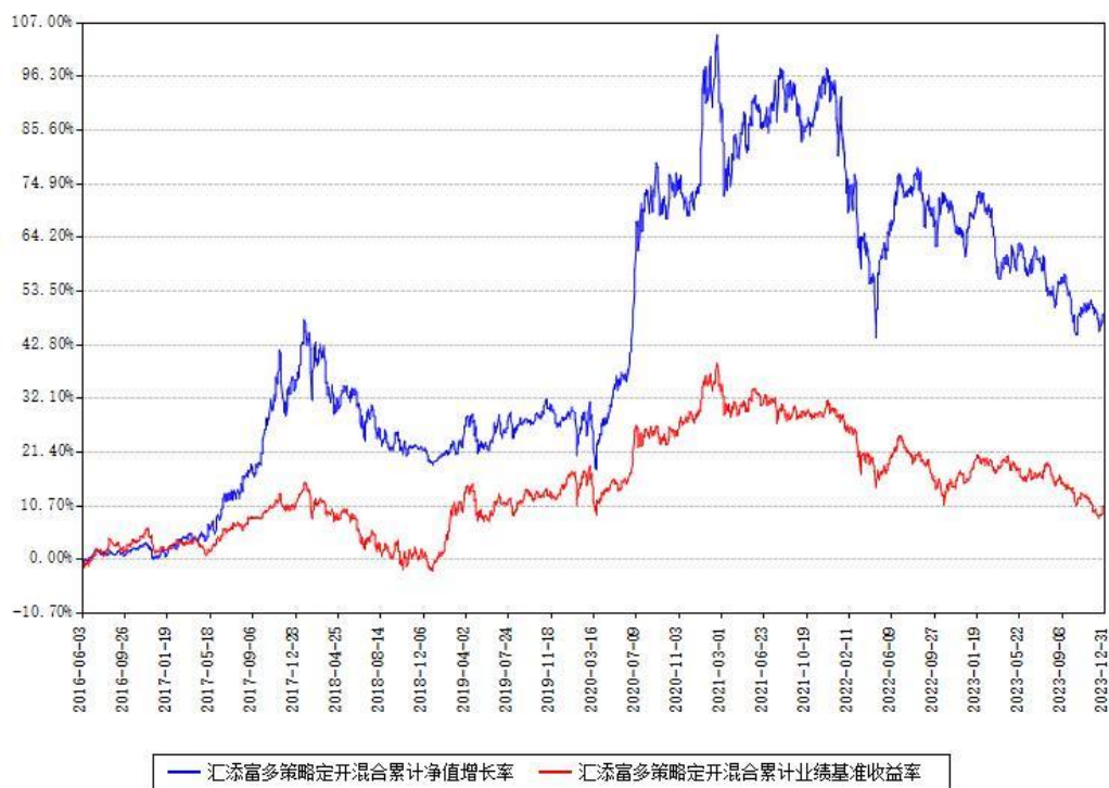
汇添富多策略定开混合累计净值增长率与同期业绩基准收益率对比图

注：本基金建仓期为本《基金合同》生效之日（2016年06月03日）起6个月，建仓期结束时各项资产配置比例符合合同约定。