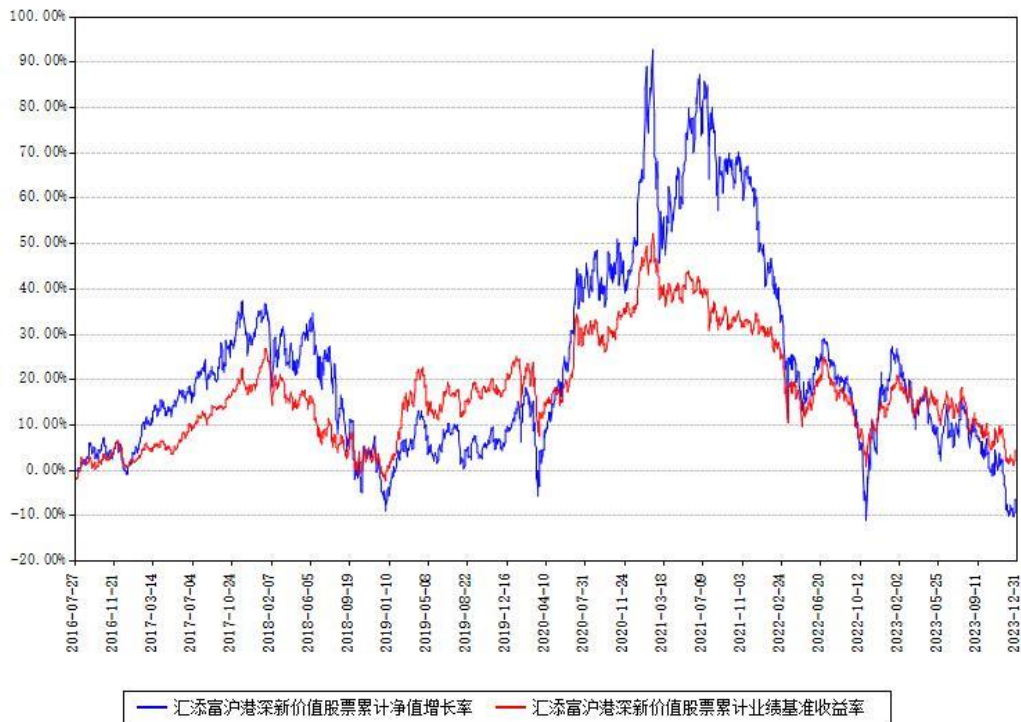
汇添富沪港深新价值股票累计净值增长率与同期业绩基准收益率对比图

注：本基金建仓期为本《基金合同》生效之日（2016年07月27日）起6个月，建仓期结束时各项资产配置比例符合合同约定。