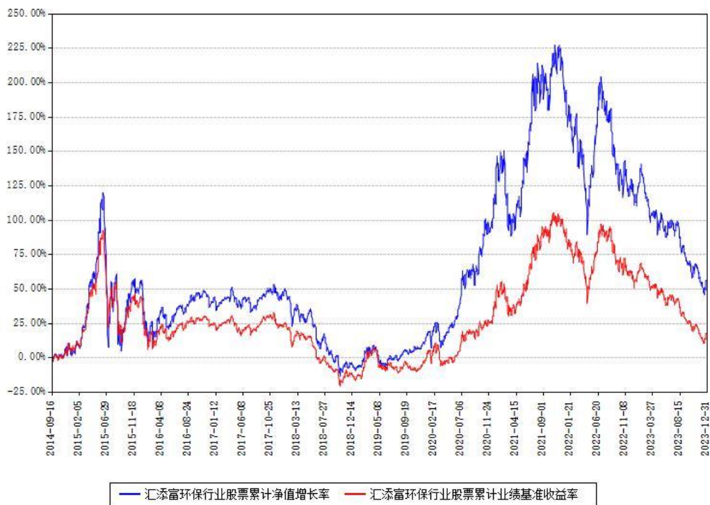
汇添富环保行业股票累计净值增长率与同期业绩基准收益率对比图

注：本基金建仓期为本《基金合同》生效之日（2014年09月16日）起6个月，建仓期结束时各项资产配置比例符合合同约定。