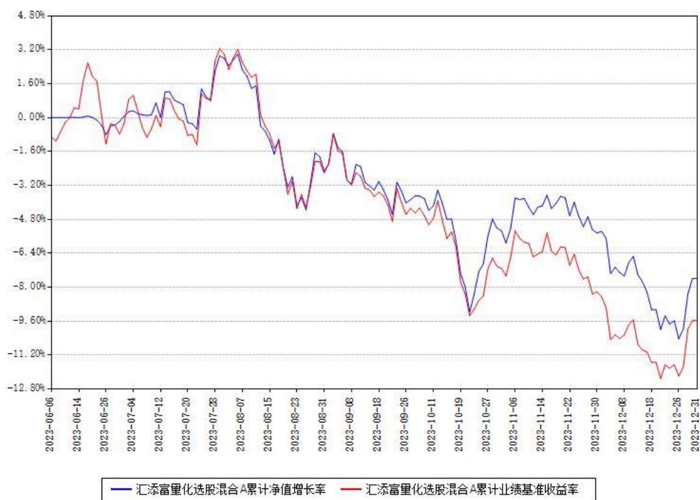
汇添富量化选股混合A累计净值增长率与同期业绩基准收益率对比图