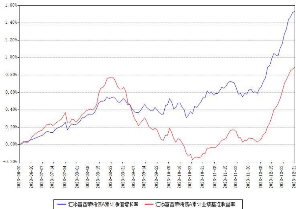
汇添富鑫荣纯债A累计净值增长率与同期业绩比较基准收益率对比图