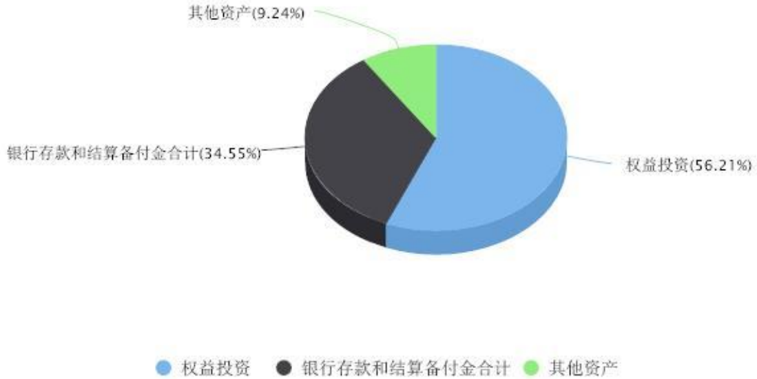
投资组合资产配置图表 数据截止日期:2023年12月31日