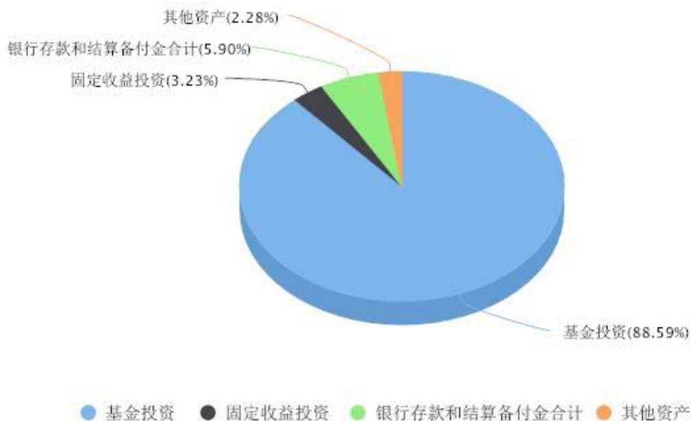
投资组合资产配置图表 数据截止日期:2023年12月31日