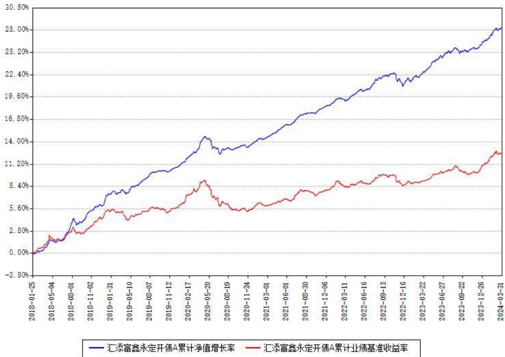
汇添富鑫永定开债A累计净值增长率与同期业绩比较基准收益率对比图