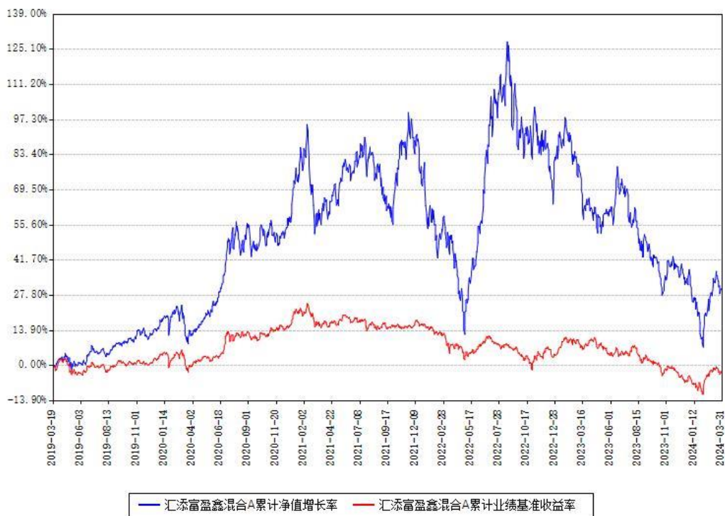
汇添富盈鑫混合A累计净值增长率与同期业绩基准收益率对比图