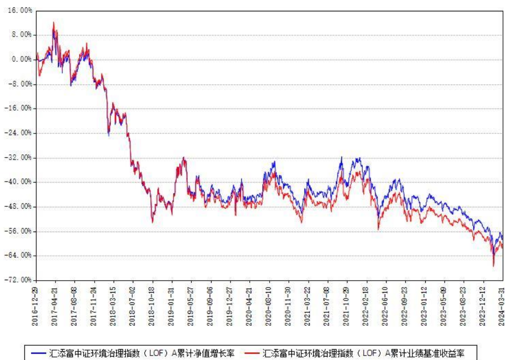
汇添富中证环境治理指数（LOF）A累计净值增长率与同期业绩比较基准收益率对比图