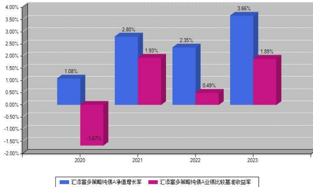
汇添富多策略纯债A每年净值增长率与同期业绩基准收益率对比图

注：数据截止日期为2023年12月31日，基金的过往业绩不代表未来表现。本《基金合同》生效之日为2020年04月01日，合同生效当年按实际存续期计算，不按整个自然年度进行折算。