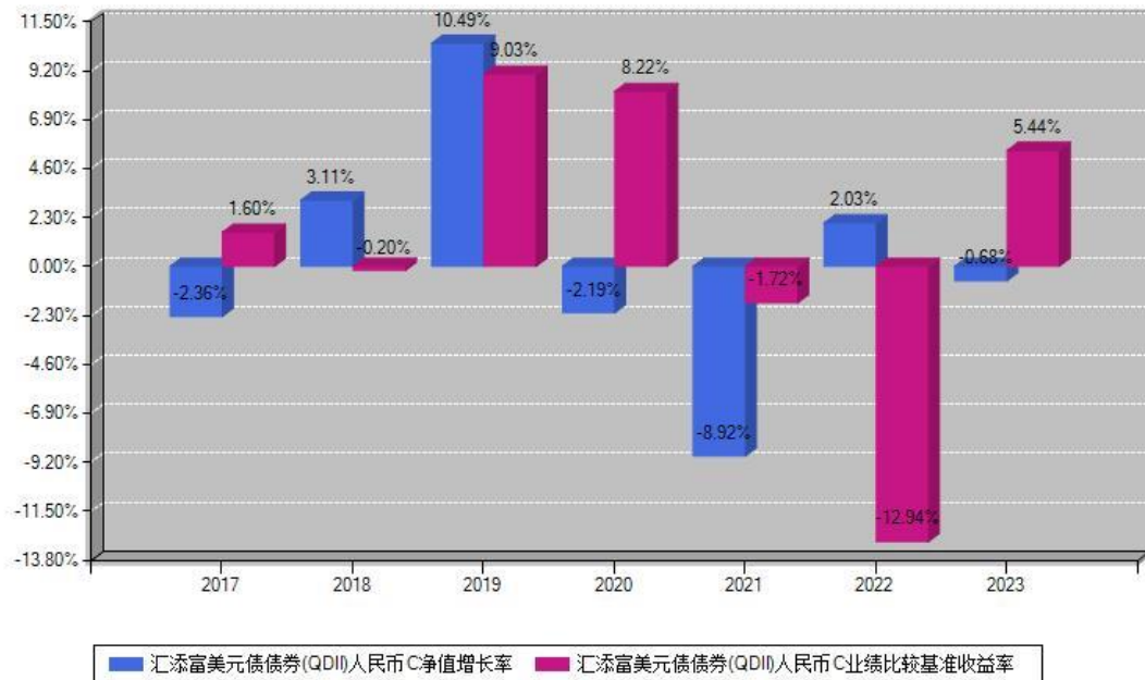
汇添富美元债债券(QDII)人民币C每年净值增长率与同期业绩基准收益率对比图

注：数据截止日期为2023年12月31日，基金的过往业绩不代表未来表现。本《基金合同》生效之日为2017年04月20日，合同生效当年按实际存续期计算，不按整个自然年度进行折算。