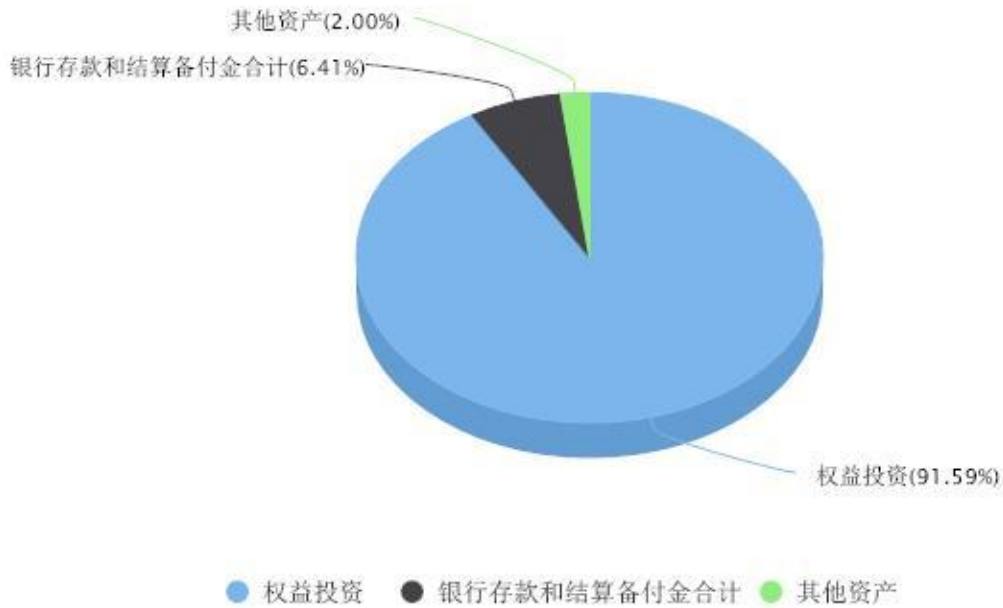
投资组合资产配置图表 数据截止日期:2024年03月31日